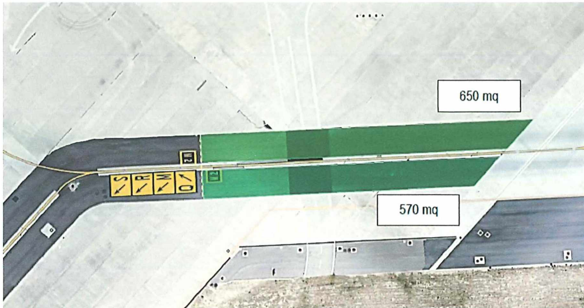
Figura 1: Planimetria di inquadramento